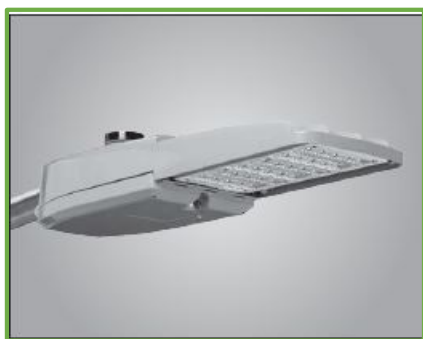
135W a 127-277 Volts