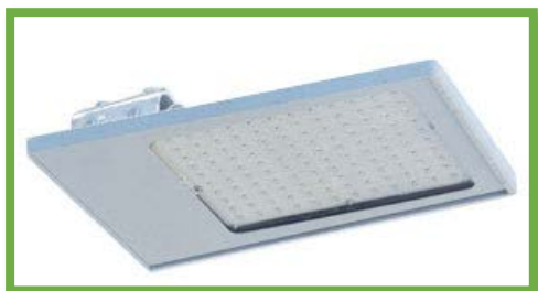
100W a 127-220 Volts